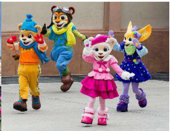
เที่ยง อีสระอาหารกลางวัน ณ สวนสนุกเอเวอร์แลนด์ เพื่อความสะดวกในการท่องเที่ยว