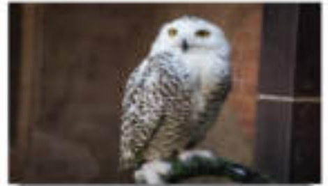
ชมนกจุกทิม- (นกจุกทิมหายาก)