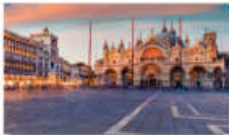
มหาวิหารเซ็นต์มาร์ก