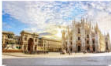
เมืองมิลาน