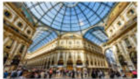
Galleria Vittorio Emanuele II