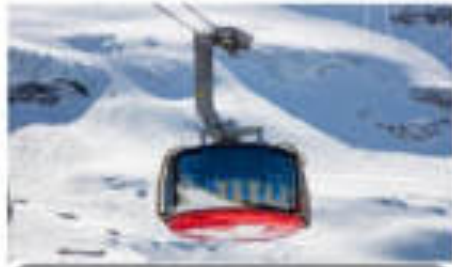
ยอดเขาท็อลิส