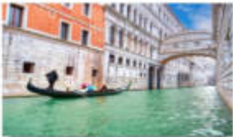
สะพานคอนฮายใจ