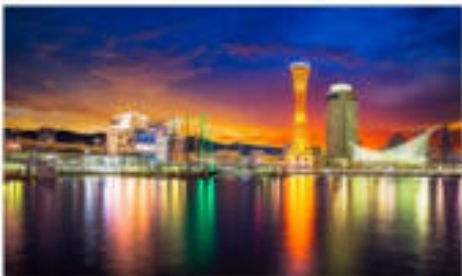
โทเอนฮาร์เบอร์แลนด์