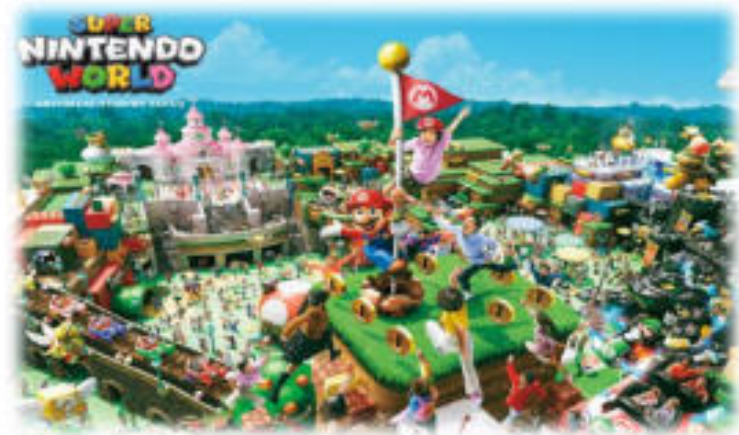
Super Nintendo World