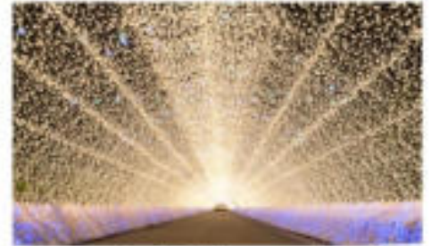
เทศกาลประดับไฟนานาะโนะซาโตะ