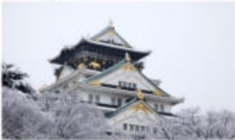
เข้าชมปราสาทโอซาก้า