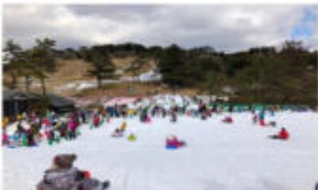
ลานสกีร็อกโก สโนว์พาร์ค