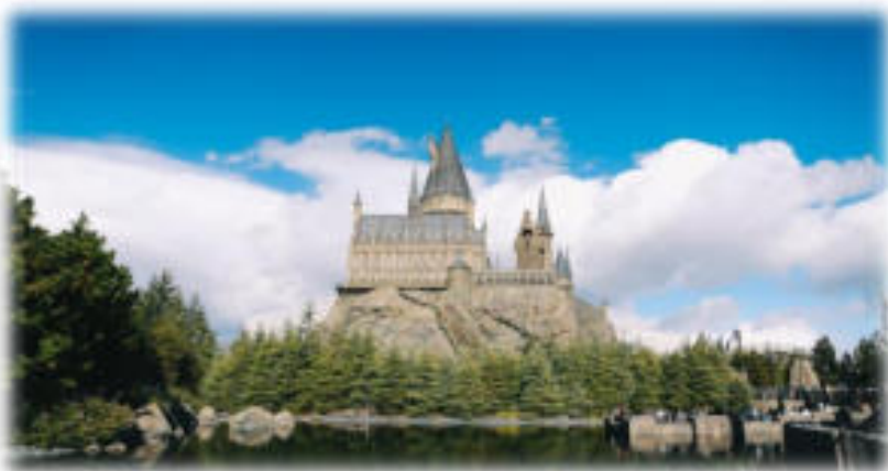
The Wizarding World Harry Potter