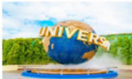
ยูนิเวอร์ซัล สตูดิโอส์