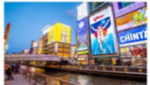
โตเกียวโมริ