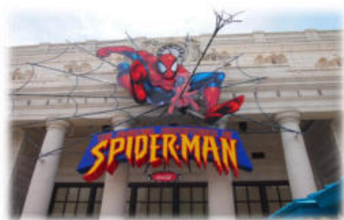
The Amazing Adventure of Spiderman