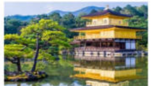
วัดคินคะคุจิ