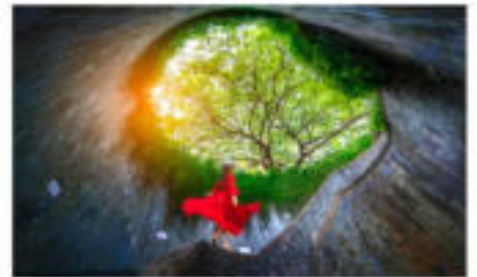
อุโมงค์ต้นไม้