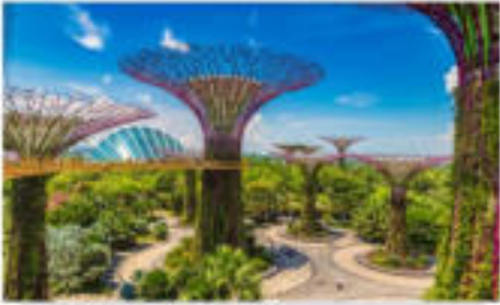
การ์เด้นบายเดอะเบย์