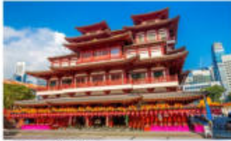
วัดพระเจี๊ยะท้าว