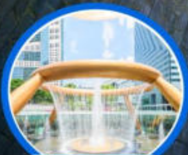
น้ำพุแห่งโซคลาก