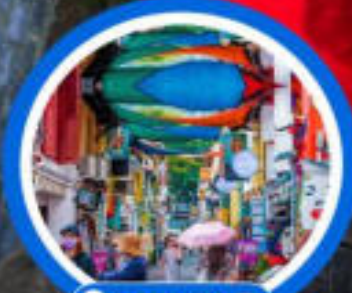
ตรอกฮาจิ