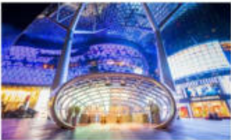
ซอปปิงออร์ชาร์ด