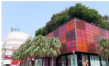
IMM เอาก์เลียด