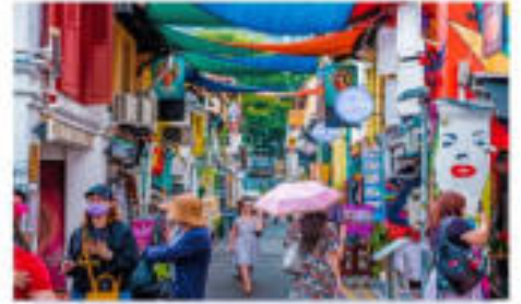
ตรอกฮาจี