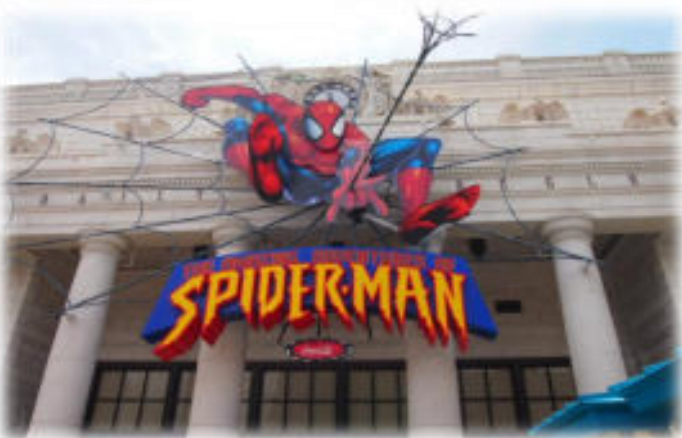
The Amazing Adventure of Spiderman