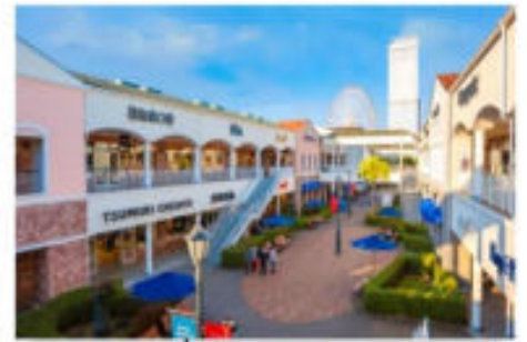
ริงกุ พรีเมียมเอาก์เล็ท