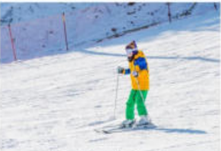
ลานสกีร็อคโค สโนว์พาร์ค