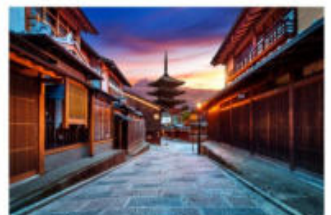
ถนนโบราณอิทากาชิยาม่า