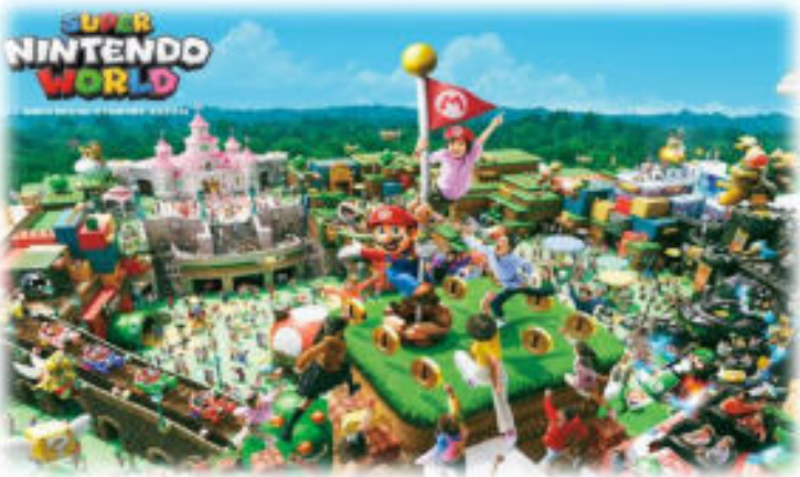
Super Nintendo World