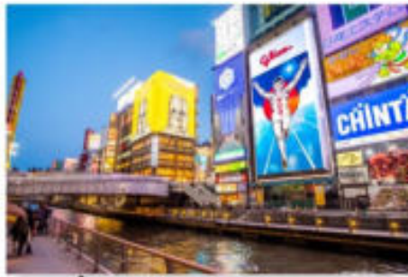
ช้อปปิ้งโซนชิมาชิ