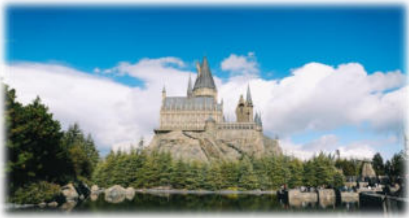
The Wizarding World Harry Potter