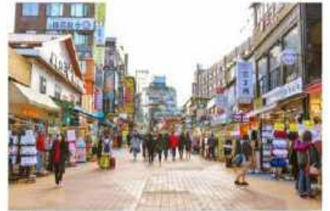
ย่านฮงแด