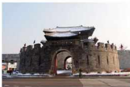
ป้อมปราการฮวาซอง