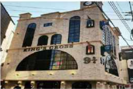
คาเฟ่แฮรี่พ็อตเตอร์