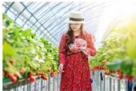
ฟาร์มสตรอว์เบอร์รี่ออร์แกนิก