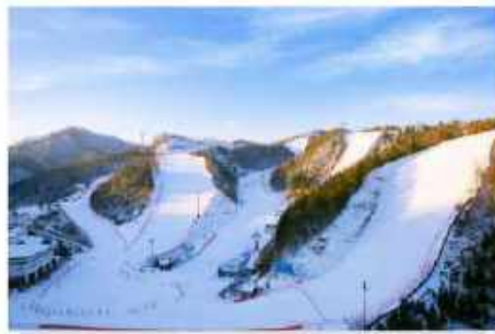
สกีรีสอร์ท กิจกรรมลานหิมะ