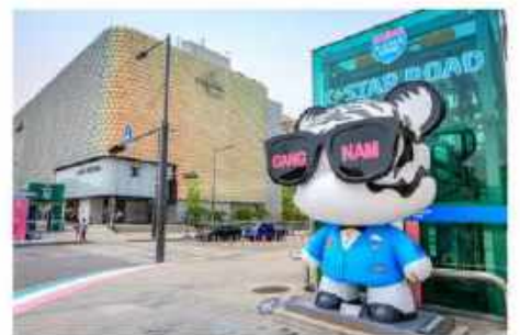
ช้อปปิ้งฮัพกูจง