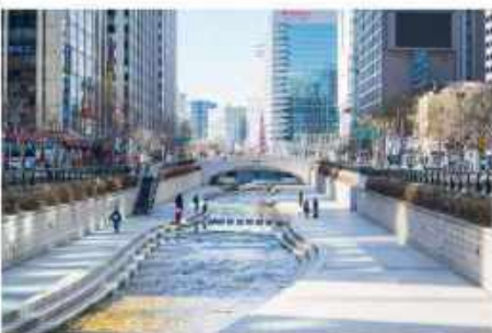
คลองชองกเยซอน