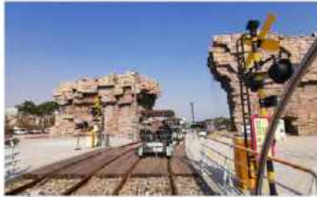
ป็นเรลโบคัษนรางรถไฟ