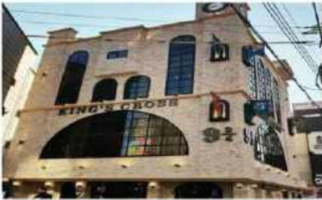
คาเฟ่แฮร์ฟอตเตอร์