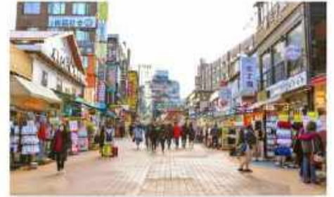
ย่านฮงแด