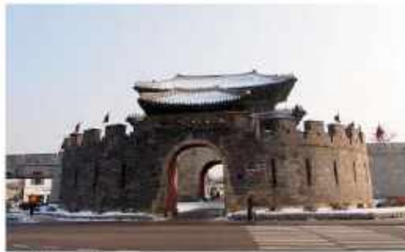
ป้อมปราการฮวาซอง