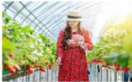
ฟาร์มสตรอว์เบอร์รี่ออร์แกนิก