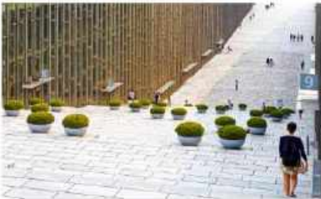
มหาวิทยาลัยอึองวา