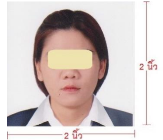
รูปถ่ายสีหน้า ต้องเห็นสัดส่วนใบหน้า เกิน 50%

*** กรุณาจัดเตรียมเอกสารตามที่ระบุเพื่อผลประโยชน์ในการพิจารณาวีซ่าของท่าน ***