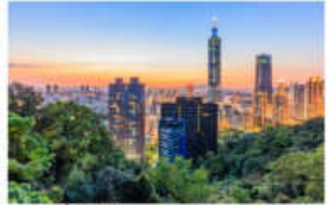
ช้อปปิ้งตึกไทเป101