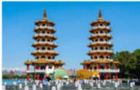
เจดีย์เสื่อเจดีย์มังกร