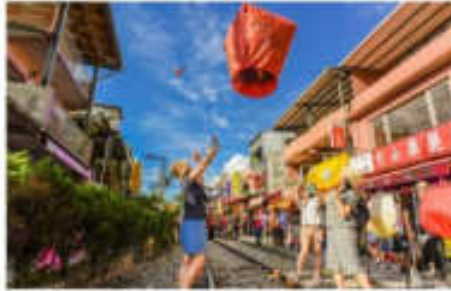
ปล่อยโคมลอยบนรางรถไฟ