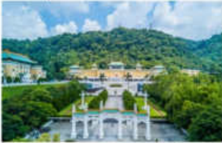
เข้าชมพระราชวังต้องห้ามกุ๊กกง