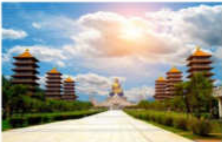
วัดไฟทวงซาน