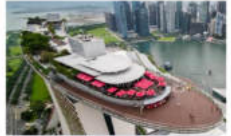
มารินาเบย์แซนด์ส