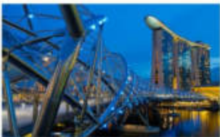
สะพานเฮลิคซ์