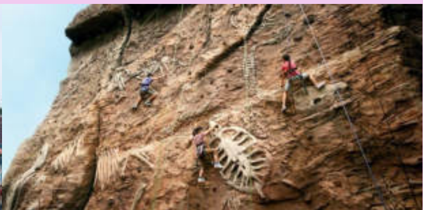
Amber Rock Climb