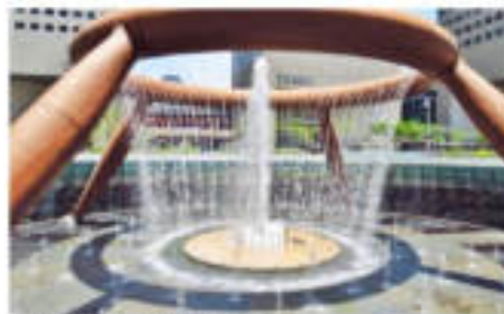
น้ำพุแห่งโชคกลาง