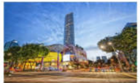
ชอปปิงออร์ชาร์ด