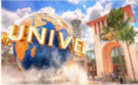
ยูนิเวอร์แซล สตูดิโอ