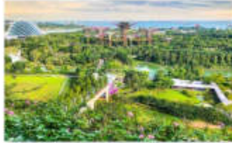
การ์เด้น นาย เตอะเบย์