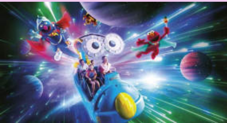
Sesame Street Spaghetti Space Chase