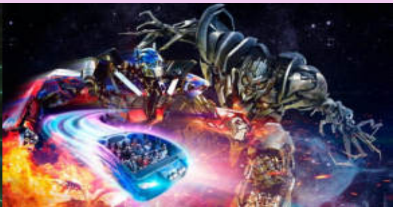
TRANSFORMERS The Ride