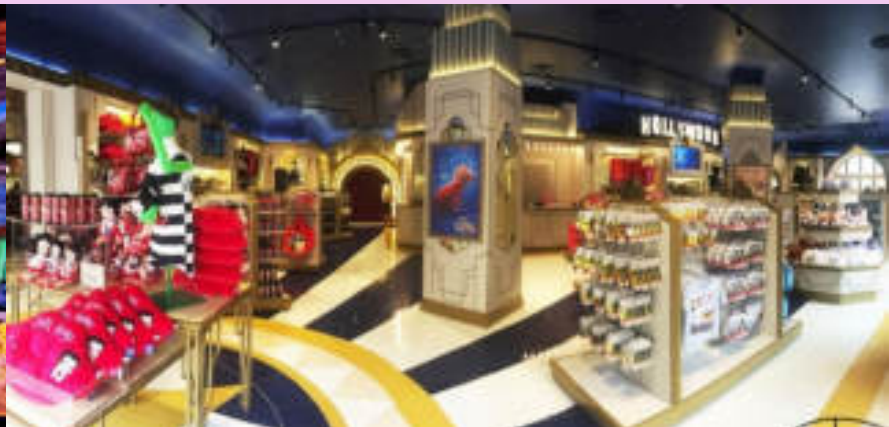
Universal Studios Store