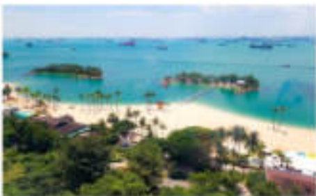
หาดซิลโซ