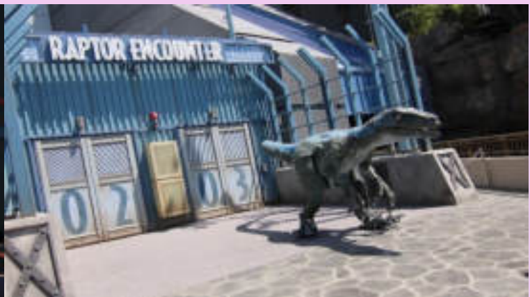
Raptor Encounter with Blue