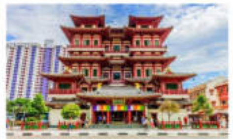
วัดพระเชี้ยวแก้ว