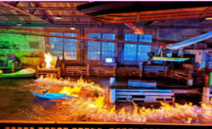
Lights, Camera, Action! Hosted by Steven Spielberg