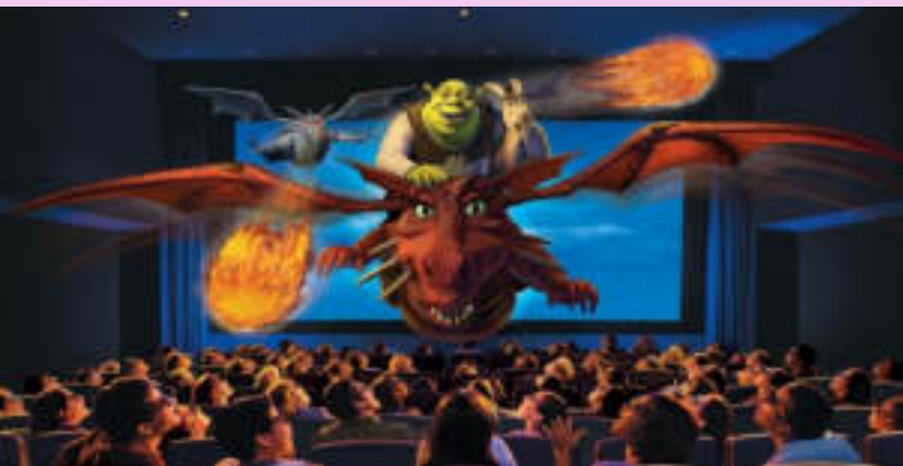
Shrek 4-D Adventure