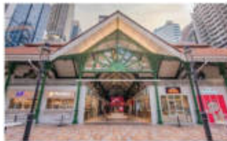
Lau Pa Sat Food Center