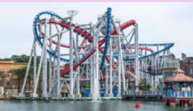
Battlestar Galactica: Human vs. Cylon