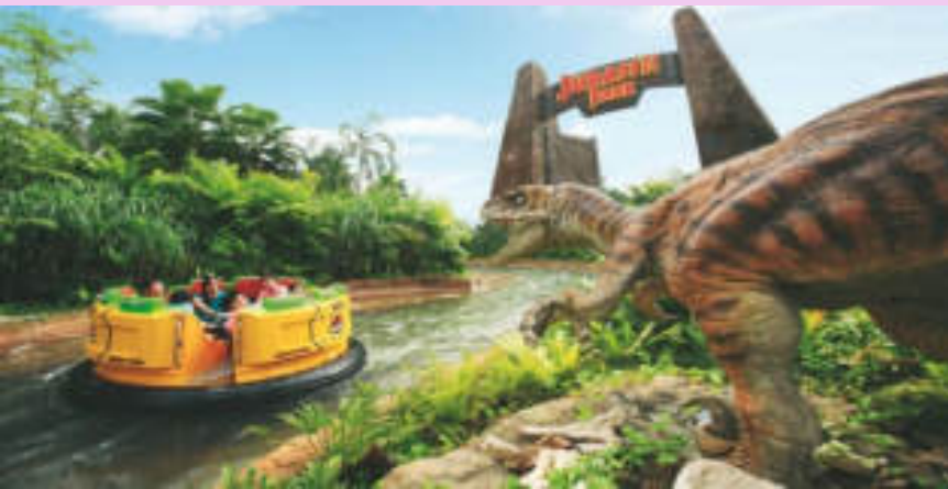
Jurassic Park Rapids Adventure