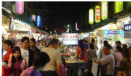
ฟงเจียไนท์มาร์เก็ต