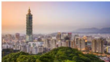
ช้อปปิ้งตึกไทเป101