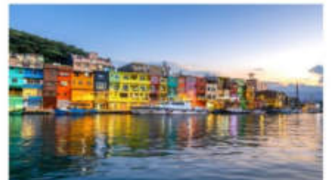
ท่าเรือประมงเจิ้งปิ่น