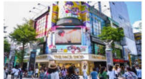
ช้อปปิ้งซีเหมินติง