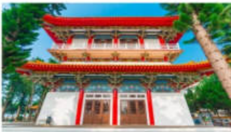
วัดพระถังซำจั๋ง