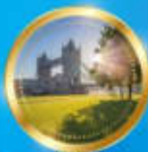
ฤดูร้อน มิถุนายน-สิงหาคม 15 °C - 23 °C