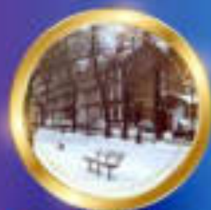
ฤดูหนาว กุมภาพันธ์-พฤษภาคม 2 °C - 11 °C