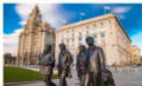
อีสเตอร์พอส