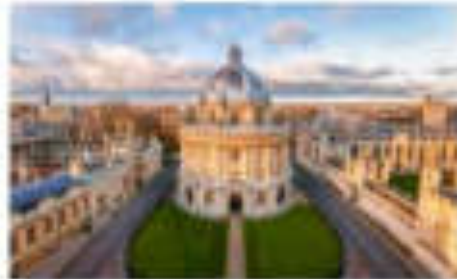
อีสทิงฟอร์ด