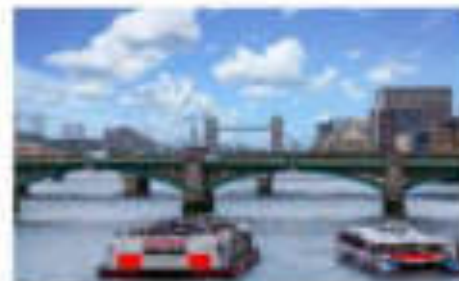
ลอนดอนแม่น้ำทามส์