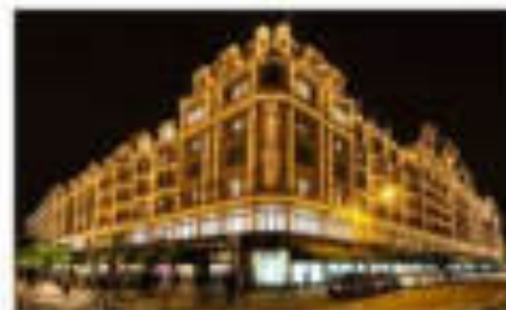
พิงก์เตอร์วอดส์