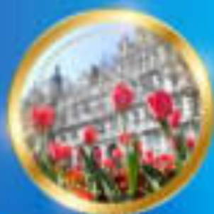
ฤดูใบไม้ผลิ มิถุนายน-พฤศจิกายน 4 °C - 15 °C