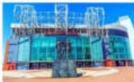
แมนเชสเตอร์