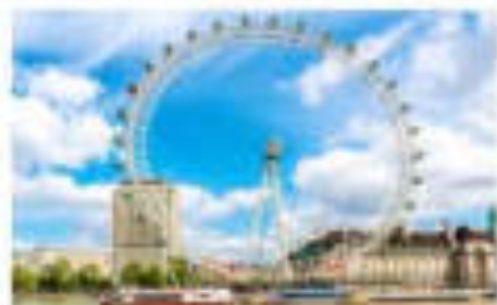
ลอนดอนตาวาย