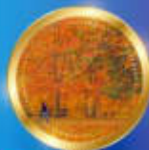
ฤดูใบไม้ร่วง กันยายน-พฤศจิกายน 7 °C - 15 °C