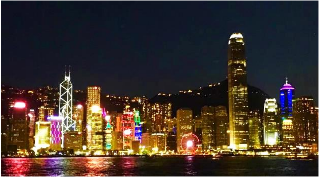
ที่พัก Ease Access Hotel หรือเทียบเท่า