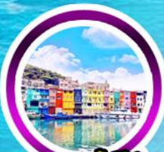
ท่าเรือเจี๋ยปิ่น