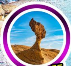
หินเสี้ยรธาฮัน