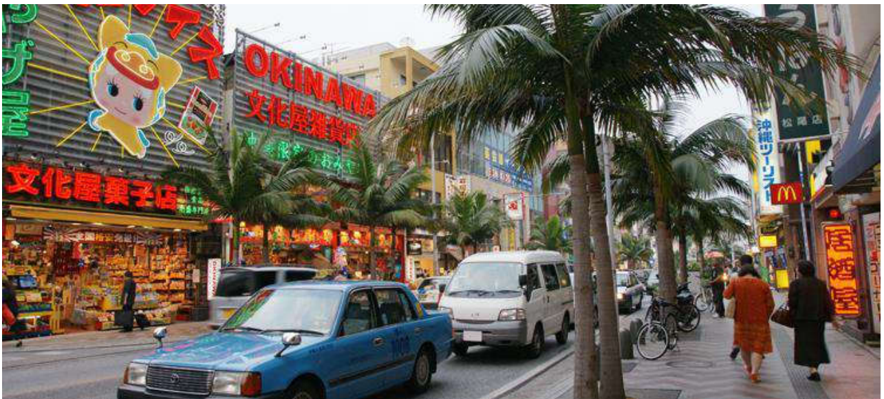
ที่พัก HOTEL ART STAY NAHA KOKUSAI-DORI หรือเทียบเท่า

วันที่ห้า ท่าอากาศยานนาสะ โอกินาวา – ท่าอากาศยานสุวรรณภูมิ กรุงเทพฯ ประเทศไทย