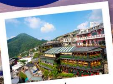
จิวเฟิ่น

เม.ย 63 : 07 - 10 / 28 เม.ย. - 01 พ.ค. 63