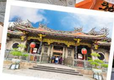
วัดหลงชาน