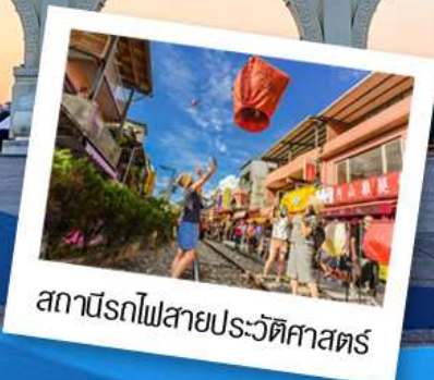
สถานีรถไฟสายประวัติศาสตร์