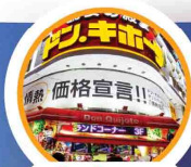
ช้อปปิ้งชินจูกุ