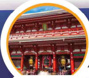
วัดอาซากุสะ