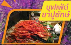
บุฟเฟ่ต์ ซาปูยักซ์