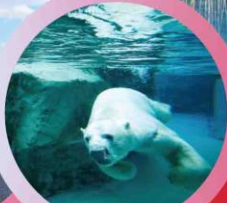
สวนสัตว์อาซาฮยาม่า