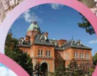
ตึกรัฐบาลเก่า