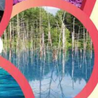
บ่อน้ำสึฟ่า