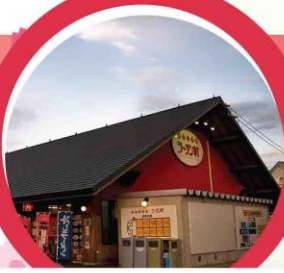
หมู่บ้านราเมนอาซาฮิคาว่า