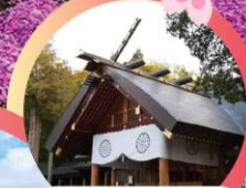
ศาลเจ้าออกโกโตะ