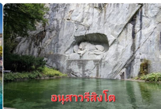
อนุสาวรีย์สิงโต