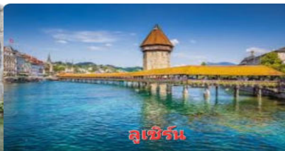
ลูเซิร์น