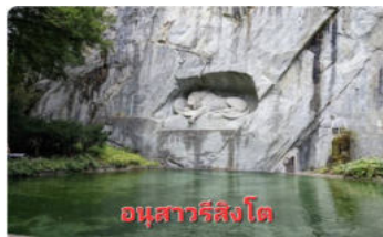
อนุสาวรีย์สิงโต

ลูเซิร์น (KAPELLBRUCKE) ซึ่งเป็นสะพานไม้ที่มีหลังคาคลุมตลอดทอดตัวข้ามแม่น้ำ รูซซ์ (REUSS) อายุเก่าแก่กว่า 400 ปี และยังเป็นสัญลักษณ์ของสวิส...อิสระให้ท่านช้อปปิ้งสินค้าชั้นนำของสวิสตามอสังขย อาทิ นาฬิกาชั้นนำ ผ้าลูกไม้สวิส ช็อคโกแลต มิดพับวิกทอเรีย นาฬิกาแก้ว ฯลฯ