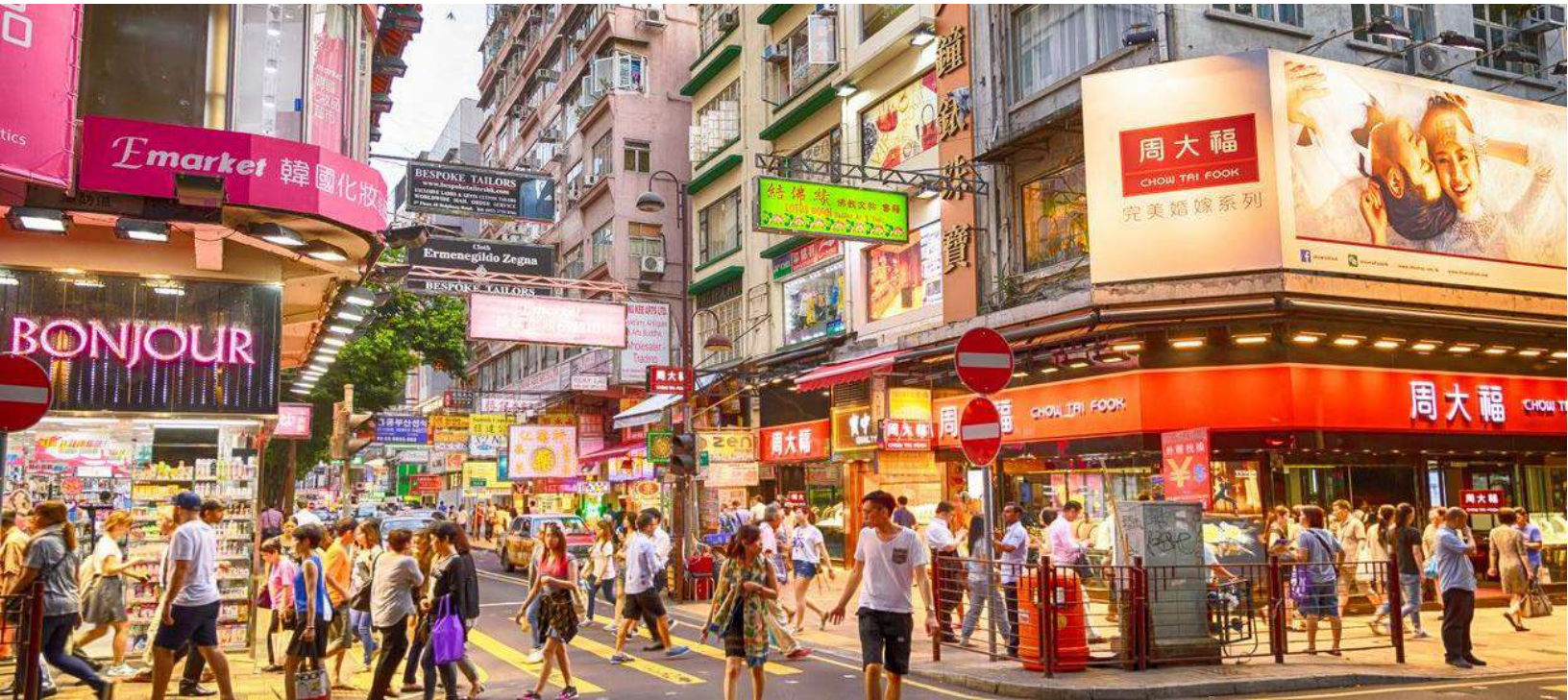
พักที่โรงแรม PRUDENTIAL HOTEL HONG KONG ระดับ 4 ดาว หรือเทียบเท่า

จากนั้น นำท่านอิสระในการช้อปปิ้งตามอัธยาศัย บนถนนนาธาน ณ ย่านจิมซาจุ่ย ซึ่งมีร้านค้ามากมายให้ท่านได้เลือกซื้อมากมายราคาถูก เช่น GIORDANO, BOSSINI เป็นต้น เพื่อเป็นของขวัญของที่ระลึก ของขวัญ หรือเลือกเดินช้อปปิ้งสินค้าห้างปลอดภาษีดีฟรี่ และโอเชียนเทอร์มินัลแหล่งรวมสินค้าชั้นนำชื่อดัง ที่มีร้านค้าให้ท่านเดินช้อปปิ้งกว่า 700 ร้านค้า อาทิ ARMANI, ESPRIT, EMPORIO, ARMANI, DKNY, MARK & SPENCER และของฝากคุณหนูที่ TOY'R US หรือเดินช้อปปิ้งสินค้าบนถนนนาธาน ซึ่งเป็นแหล่งรวมเครื่องใช้ไฟฟ้า และอุปกรณ์สื่อสารที่ทันสมัย