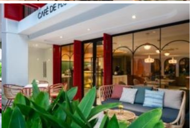
(โรงแรมที่พักใหม่ ใจกลางเมืองฮานอย)